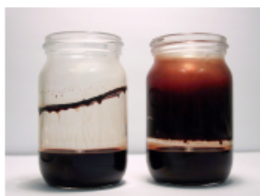
Pyro-Kote 220 COMPETIDOR