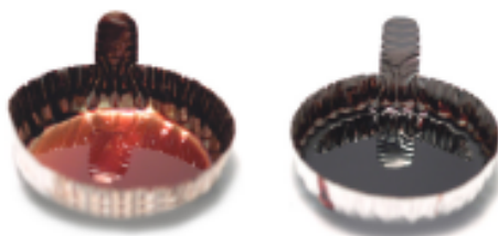
Pyro-Kote 220 COMPETIDOR